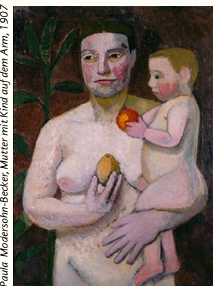
Foto: Paula Modersohn-Becker, Mutter mit Kind auf dem Arm, 1907

Im Mittelpunkt des Worpsweder Jubiläumsprogramms steht die Große Sommerausstellung »Mythos und Moderne – 125 Jahre Künstlerkolonie Worpswede« der Worpsweder Museen vom 11. Mai bis zum 14. September 2014. Anhand der entscheidenden historischen Wendepunkte wird die spannende Geschichte des Künstlerdorfs vor dem Hintergrund der europäischen Kunst- und Zeitgeschichte erzählt. Die vier Ausstellungssektionen werden im Haus im Schluh, dem Barkenhoff, der Großen Kunstschau und der Worpsweder Kunsthalle gezeigt.